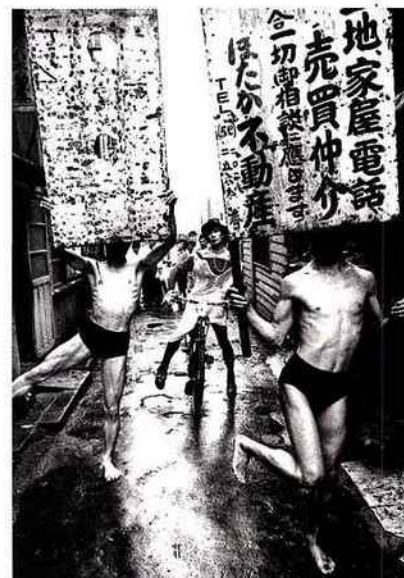
Danseurs butô, 1961

«Tokyo 1961 - William Klein» jusqu'au 16 mai galerie Polka - 12, rue Saint-Gilles - 75003 Paris 01 76 21 41 30 - www.polkagalerie.com